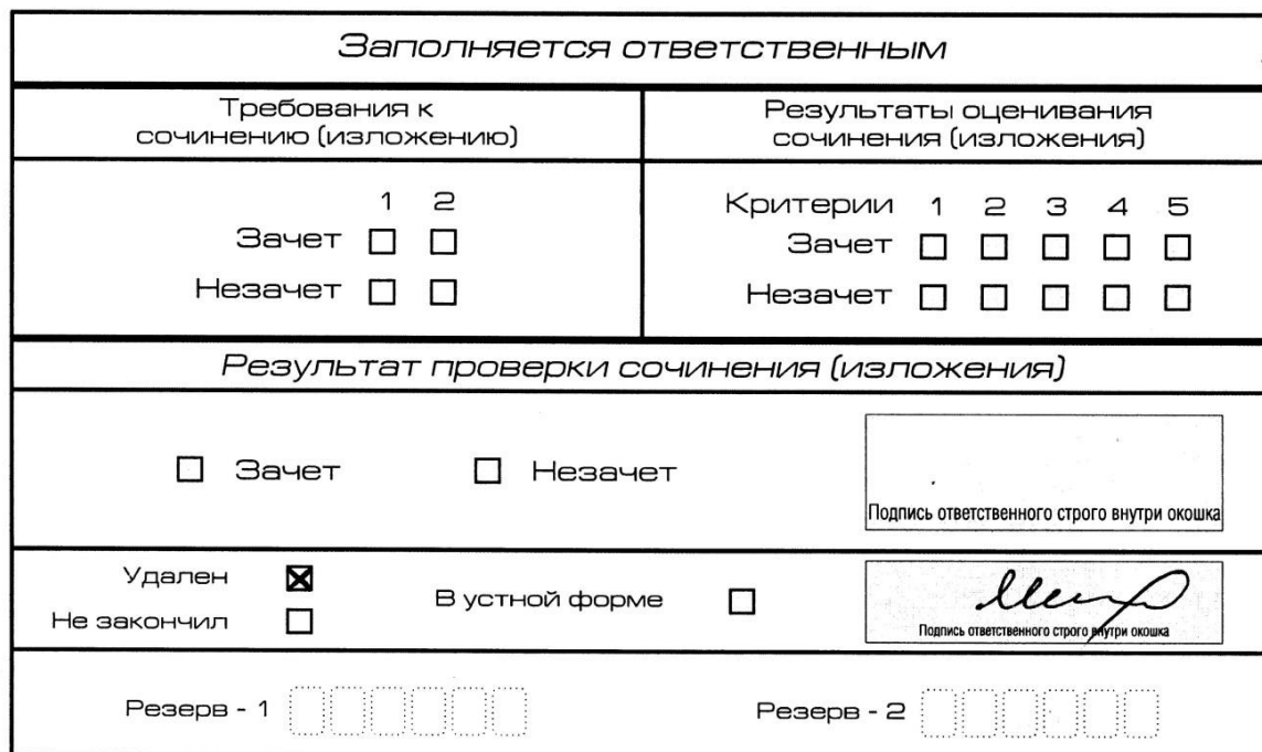
Рис. 13. Заполнение полей нижней части бланка регистрации (удаление с экзамена)

В случае если участник итогового сочинения (изложения) нарушил установленные требования, изложенные в пункте 27 Порядка проведения государственной итоговой аттестации по образовательным программам среднего общего образования (приказ Министерства просвещения Российской Федерации и Федеральной службы по надзору в сфере образования и науки от 07.11.2018 г. №190/1512), он удаляется с итогового сочинения (изложения). Член комиссии по проведению итогового сочинения (изложения) составляет «Акт об удалении участника итогового сочинения (изложения)» (форма ИС-09), вносит соответствующую отметку в форму ИС-05 «Ведомость проведения итогового сочинения (изложения) в учебном кабинете ОО (месте проведения)» (участник итогового сочинения (изложения) должен поставить свою подпись в указанной форме). В бланке регистрации указанного участника итогового сочинения (изложения) необходимо внести отметку «X» в поле «Удален». Внесение отметки в поле «Удален» подтверждается подписью члена комиссии по проведению итогового сочинения (изложения) (см. рис. 13).